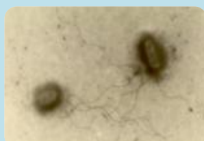
腸管出血性大腸菌O157