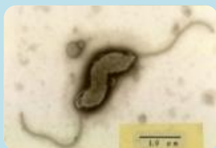
カンピロバクター